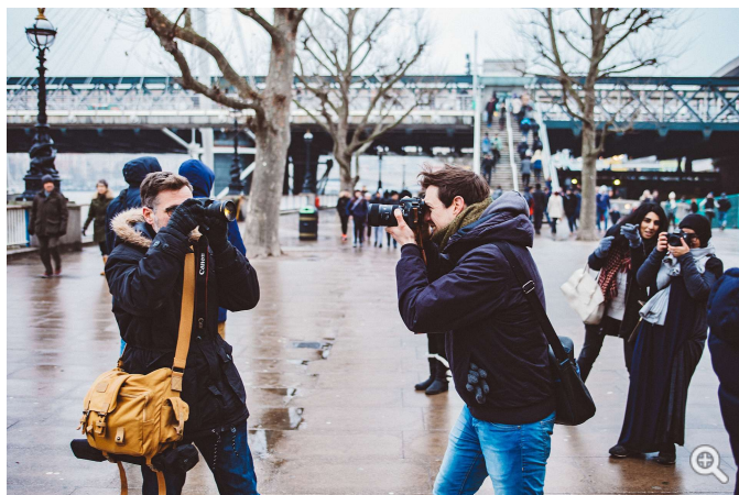
Om man bryter mot GDPR kan man få böta upp till 20 miljoner euro, eller fyra procent av den globala omsättningen.