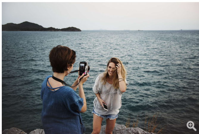
Den nya lagen gäller inte bara för de bilder som du fotograferar från och med den 25 maj 2018, utan även alla tidigare bilder som du har i ditt arkiv.