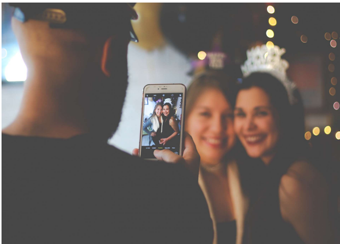
Om du publicerar bilder offentligt på sociala medier, då hamnar du troligen utanför den privata sfären och ska även som privatperson ta hänsyn till GDPR.

– Då väger man sitt eget intresse av att göra den här behandlingen mot den vars personuppgifter det gäller. Alltså om det av någon anledning kan vara viktigare att du får behandla de här bilderna än att den personliga integriteten bevaras hos dem som syns på bilderna.