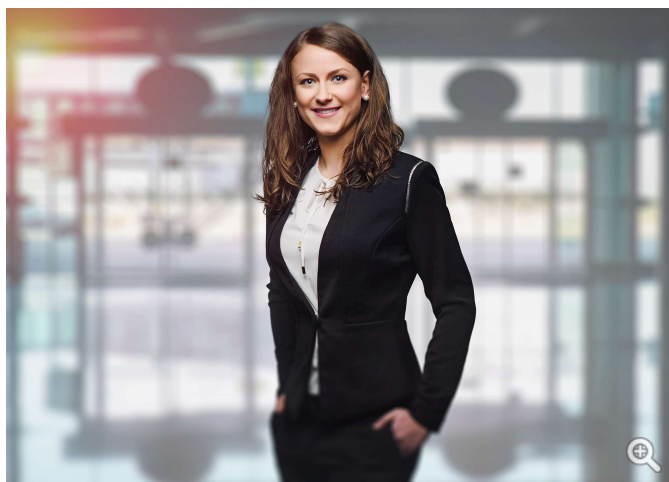
Du måste få samtycken från företagets personal när de ska fotograferas. För det är respektive anställd som äger rätten till sina personuppgifter, inte företaget.

Men, återigen, är bilderna ett resultat av ett konstnärligt skapande eller har ett journalistiskt ändamål gäller inte GDPR för dina arkivbilder. Men om samma bilder skulle börja användas i till exempel kommersiella sammanhang, då kan GDPR gälla och du måste skriva ett avtal eller skaffa dig ett samtycke.